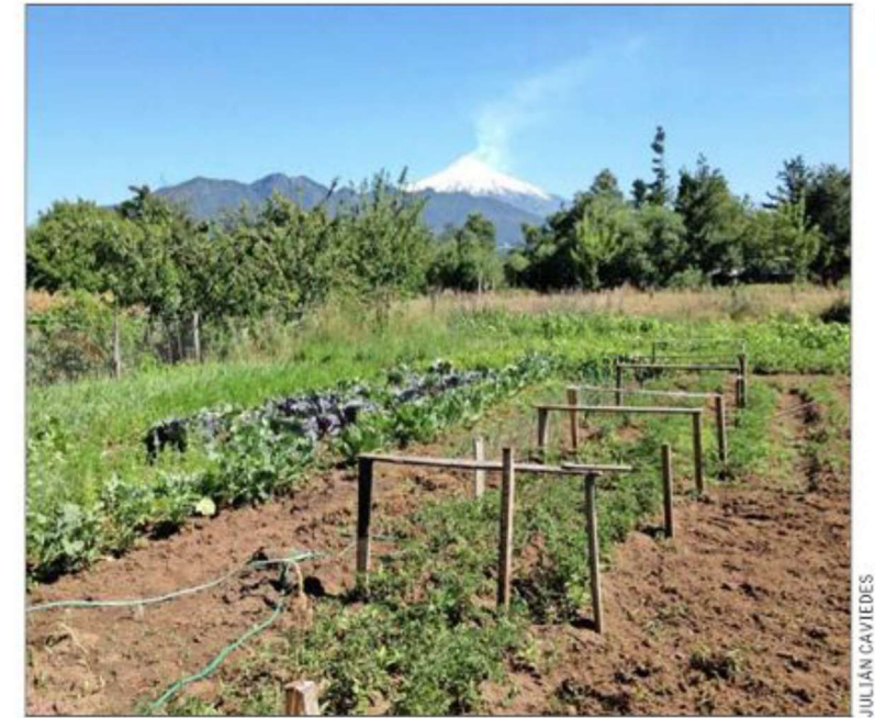
Una huerta en la zona de montaña de Pucón. Han contabilizado casi 200 hasta ahora.